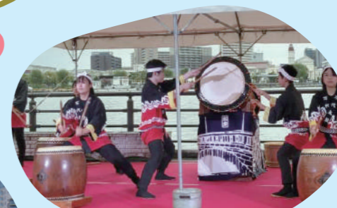
ステージイベント